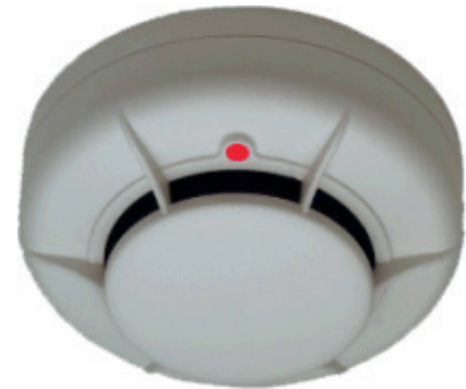
Detector Óptico Convencional Mod. ECO1003ABL A

Las bases compatibles incorporan una lengüeta de continuidad para mantener la línea de detección activa en caso de extracción del equipo con resorte de rearme en caso de volver a instalar un detector. Las pruebas de activación del equipo (Test) se realizan mediante un pulsador de rayo láser codificado.